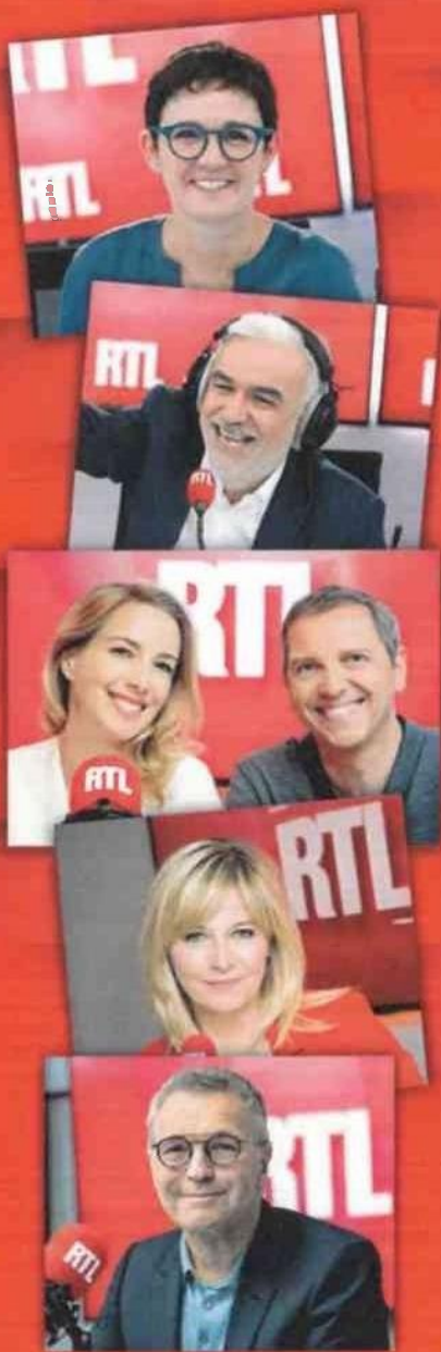
Christelle REBIÈRE, Pascal PRAUD, Sidonie BONNEC & Thomas HUGUES, Flavie FLAMENT, Laurent RUQUIER.